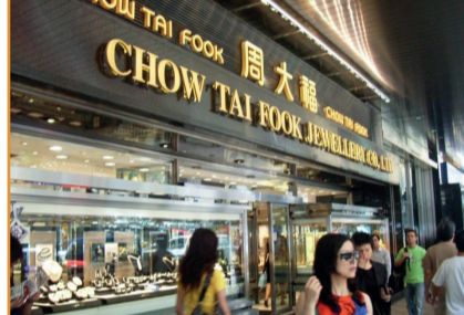
Chow Tai Fook Satışları Çin ve Hong Kong'da Arttı

Hong Kong'un en büyük mücevher perakendecilerinden biri olan TSL 30 Eylül'de sona eren dönemde kar bildirdi. Rakam küçük olsa da, bir önceki yılın aynı dönemindeki 5,4 milyon USD kayıptan sonra kara geçilmesi önemli.