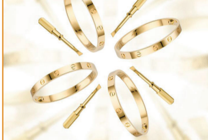
RJC, Lüks Markalar Çevre Girişimini Başlattı

Şirketin 3. çeyrek rakamlarındaki satış gelirlerinin önemli bir kısmı Çin anakarasındaki satışlardan kaynaklansa da Hong Kong satışlarının da artması dikkat çekici.