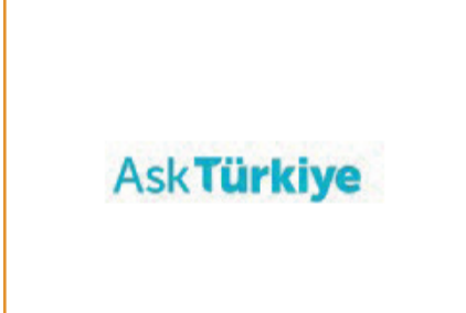
Ask Türkiye ve TurkishJewellery.Org Entegrasyonu Planlanıyor

CIBJO'nun Stephane Fischler başkanlığındaki yeni Teknoloji Komitesi tarafından hazırlanan rapor, kuyumculuk ve değerli taş endüstrisi ve ticaretinde çığır açan teknolojik atılımlara odaklanıyor.