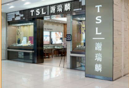
Hong Konglu TSL 3. Çeyrekte Kar Açıkladı!

Mastercard SpendingPulse'a göre, tüketiciler gardıroplarını güncelleyip tatil sezonuna hazırlanırken, ABD'de mücevher satışları Eylül ayında keskin bir artış kaydetti. Geçen yılın Eylül ayına göre mücevher satışları %55 arttı.