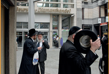
Belçika'da Ticaret Yavaş da Olsa Toparlanıyor

Responsible Jewellery Council (RJC) şirketleri çevresel hedeflere ulaşmaya yönlendirmek için Kering ve Cartier ile ortaklık kurdu. Proje çevreyi korumayı ve sürdürülebilirliği mümkün kılmayı hedefleyen bütün firmalara açık olacak.